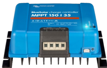
Solar Lade-Regler MPPT 150/35