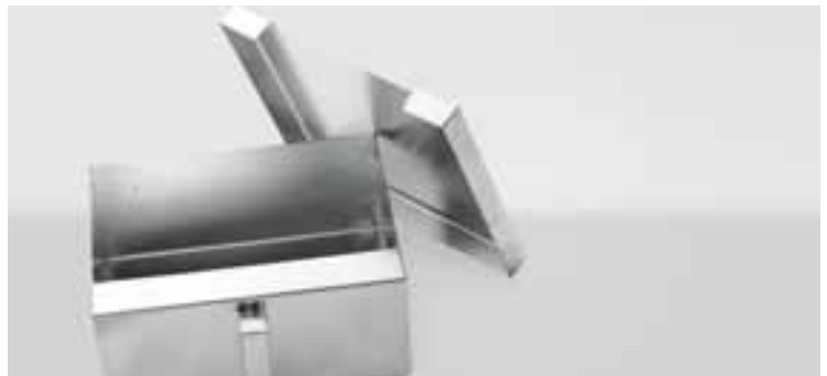
Große Aschelade mit Deckel