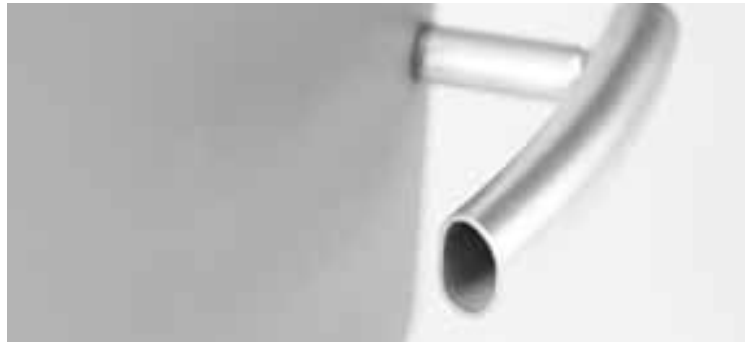
Ergonomischer und kühler Griff