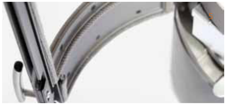
Gussrahmen und Boden