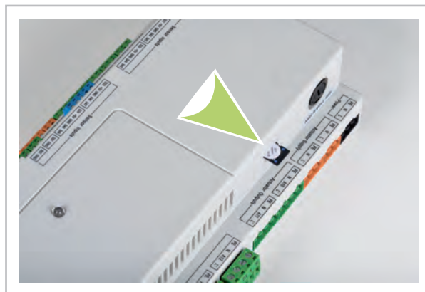
Abb. 1: I/O-Modul mit SD-Karten Slot