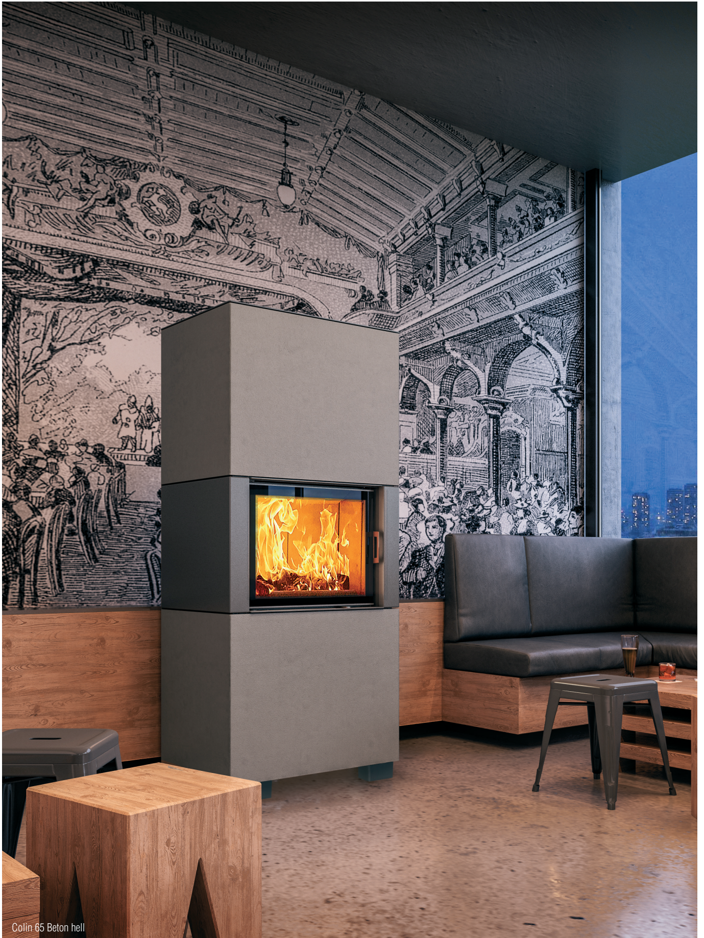
Colin 65 Beton hell